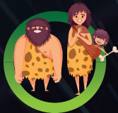
SEMAINE 1 24 au 28 juin LA PRÉ-HISTOIRE