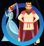
SEMAINE 4 15 au 19 juillet LE MOYEN-ÂGE