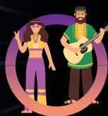
SEMAINE 6 29 juil. au 2 août LES ANNÉES 60