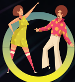
SEMAINE 7 5 au 9 août LES ANNÉES 80