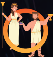
SEMAINE 2 1 er au 5 juillet L'ANTIQUITÉ