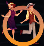
SEMAINE 5 22 au 26 juillet ANNÉES FOLLES