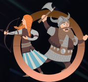
SEMAINE 3 8 au 12 juillet VIKINGS vs PIRATES