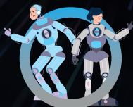
SEMAINE 8 12 au 16 août LE FUTUR